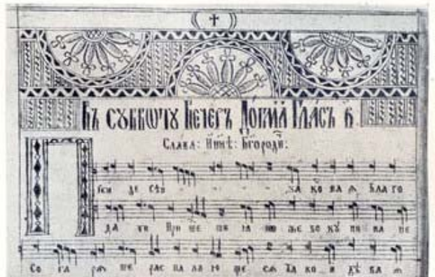
11. Тот-же Ирмологій, л. 3v.