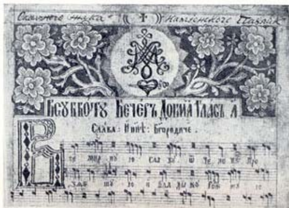
10. Ирмологій И. Югасевича 1809 г., л. 1.